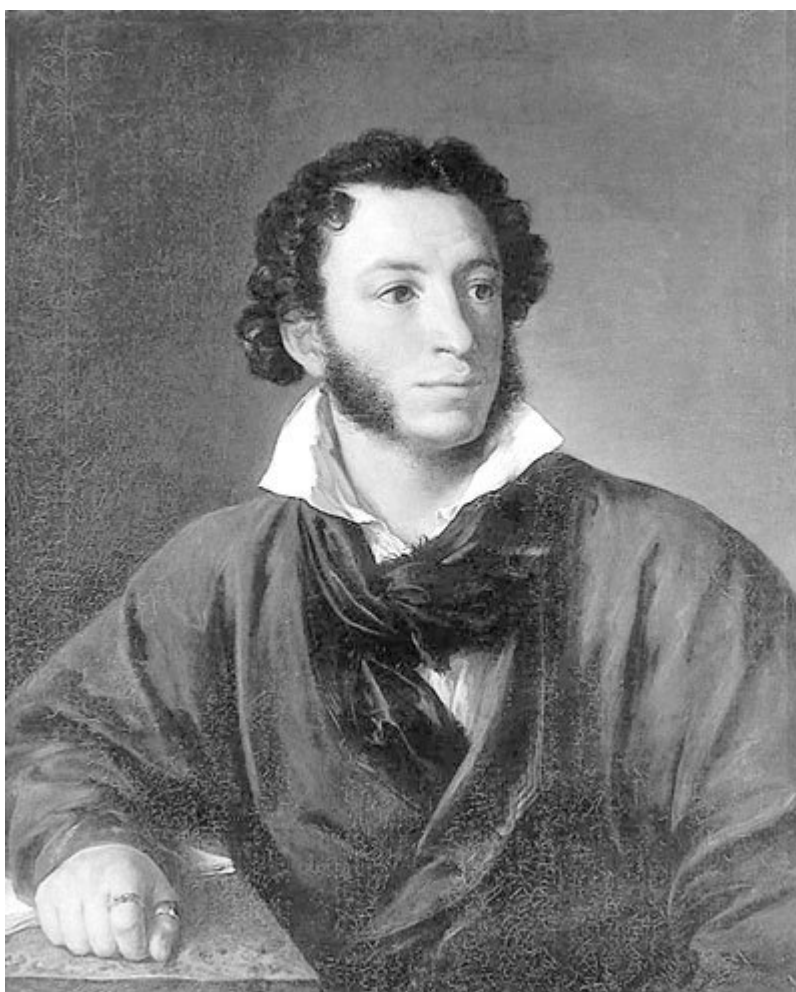
В.А. Тропинин. Портрет Александра Сергеевича Пушкина. 1827 г.