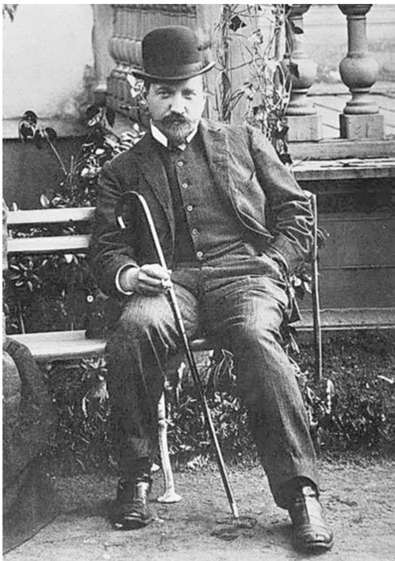
Валентин Александрович Серов