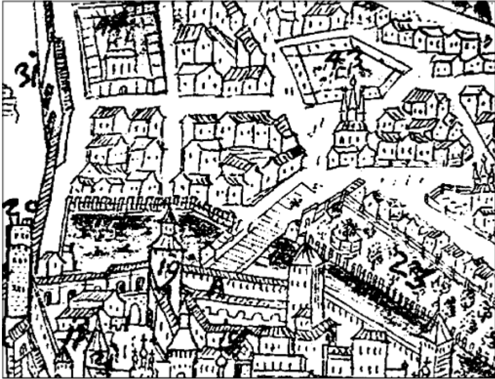
На плане Мейерберга 1661 г. Лебяжий пруд (№ 45) у Боровицкой башни (№ 19)

Итак, герцог встретился с сильной дворянской оппозицией, хотя Висмар и остался у него, но Петр был здесь ни при чем. Содержание десяти русских полков было невыносимым бременем, а тут еще и взбалмошный и непредсказуемый характер герцога. В результате Екатерина с двухлетней дочерью, будущей правительницей России Анной Леопольдовной, отправилась обратно на родину. Она жила в Петербурге, покровительствовала поэту Тредиаковскому, который так приветствовал ее приезд: