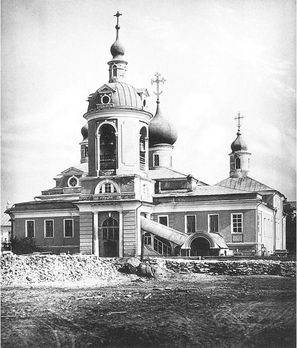
Церковь Антипия в Конюшенной

Крошечный, уже покосившийся и вросший в землю дом (№ 9), приютившийся рядом со школой, – образец рядовой застройки Москвы по типовым проектам после пожара 1812 г. Он принадлежал