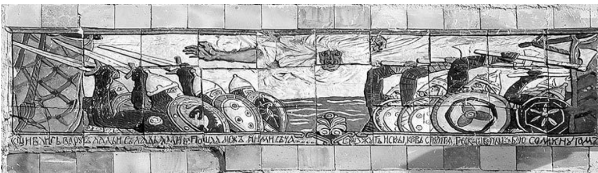
Керамическое панно на доме № 3 по Лебяжьему переулку

Во дворе этого же владения в 1913 г. построили «синематограф и театр миниатюр» П.Г. Солодовникова (архитектор С.М. Гончаров). Несколько измененный фасад синематографа, открытого в октябре того же года, выходит на Кремлевскую набережную.