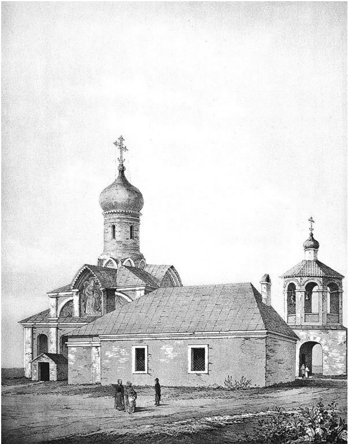
Церковь Благовещения в Старом Ваганькове