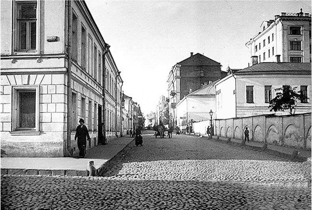
Крестовоздвиженский переулок от Знаменки. 1913 г.

По всей левой стороне в XVII в. и в первой половине XVIII в. располагалась большая усадьба князя Романа Горчакова. Каменные палаты находились примерно посередине переулка в глубине двора, а по красной линии одно за другим шли здания, возведенные в XVIII в., в которых могли быть скрыты и еще более старые постройки.