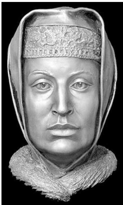
Великая княгиня Софья Витовтовна

традиций, по которой престол должен переходить к младшему брату, к князю Юрию. Вспыхнули междукняжеские распри, еще более усилившиеся после того, как Софья Витовтовна обвинила сыновей Юрия – Василия Косого и Дмитрия Шемяку – в том, что они украли золотой пояс Дмитрия Донского, и прилюдно сорвала его с Василия Юрьевича. «Произошла ссора, – рассказывает Карамзин, – Косой и Шемяка, пылая гневом, бежали из дворца, клялись отомстить за свою обиду и немедленно, исполняя повеление отца, уехали из Москвы в Галич». Сцена эта изображена на картине художника П.П. Чистякова «Великая княгиня Софья Витовтовна на свадьбе великого князя Василия Темного» (в Русском музее).