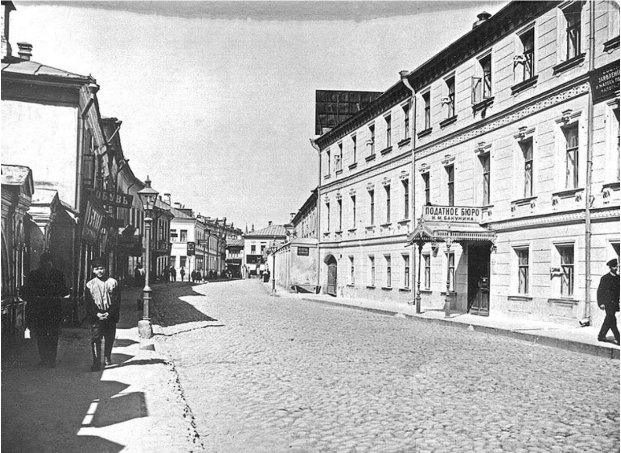
Большой Кисловский переулок в сторону Большой Никитской улицы. 1913 г.

Возможно, что этот дом включил в себя и части древних палат боярина Богдана Матвеевича Хитрово, стоявших в XVII в. как раз на этом месте. В XVIII в. участок принадлежал обер-президенту магистрата С.С. Зиновьеву, потом – стольнику С.Т. Клокачеву, с 1761 г. – князю А.С. Голицыну и в 1765 г. – младшему из знаменитых братьев Орловых, возведших Екатерину на престол в 1762 г., Владимиру Григорьевичу.