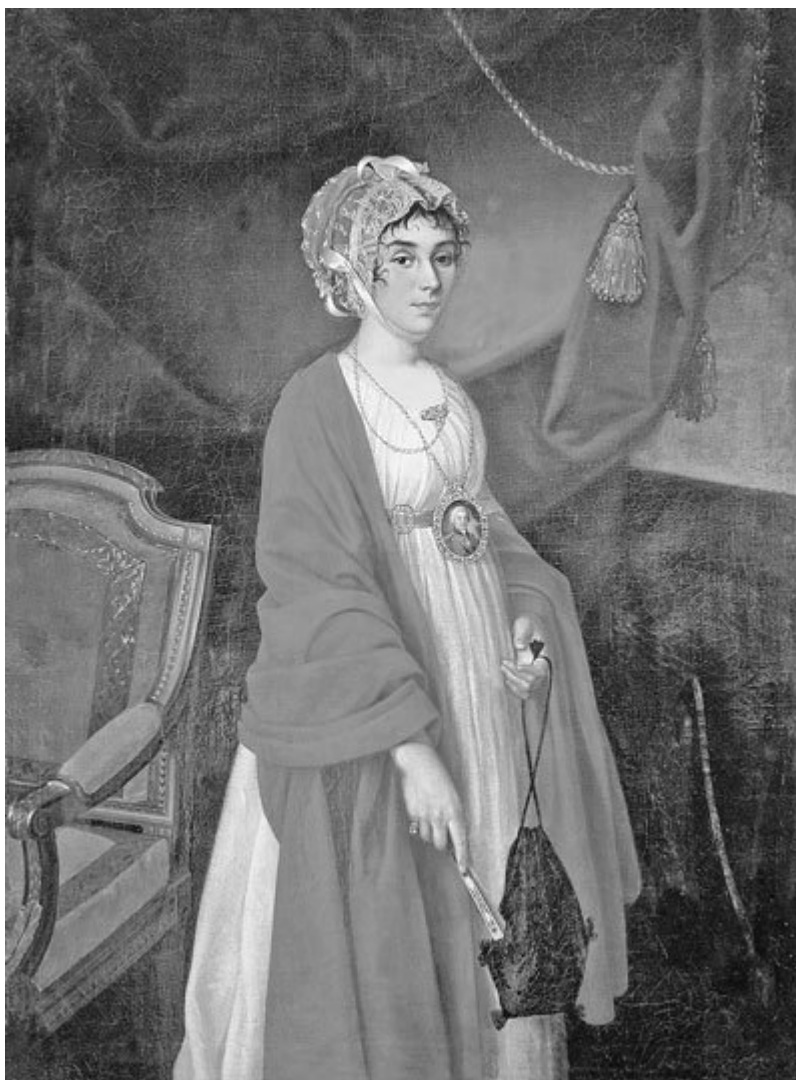
Н.И. Аргунов. Графиня Прасковья Ивановна Шереметева-Жемчугова. 1803 г.