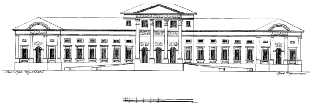
Дом Шереметева на Воздвиженке. 1832 г.

С 1863 г. в шереметевском доме находится Московская городская дума, и он значительно переделывается внутри. С переходом думы в собственное здание здесь в 1892 г. поместился Охотничий клуб. В нем каждую неделю давались спектакли Общества искусства и литературы. В сентябре 1898 г. в клубе познакомились А.П. Чехов и О.Л. Книппер. «...Знаменательный и на всю жизнь не забытый день, – вспоминала Ольга Леонардовна. – Никогда не забуду ни той трепетной взволнованности, которая овладела мною еще накануне, когда я прочла записку Владимира Ивановича (Немировича-Данченко. – Авт. ) о том, что завтра, 9 сентября, А.П. Чехов будет у нас на репетиции „Чайки“, ни того необычайного состояния, в котором шла я в тот день в Охотничий клуб на Воздвиженке. И с той встречи начал медленно затягиваться тонкий и сложный узел моей жизни».