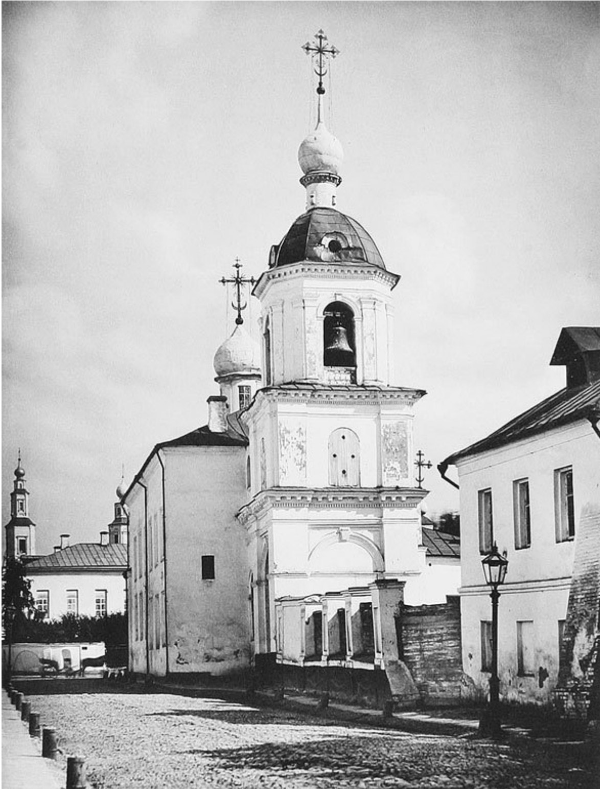
Церковь Знамения на Знаменке