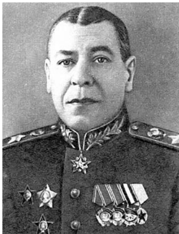
Маршал Борис Михайлович Шапошников

В 1989 г. здесь при раскопках под руководством известного археолога А.Г. Векслера были обнаружены остатки деревянных сооружений, сгоревших в грандиозный пожар 1737 г. Пожар этот начался от свечки, забытой у иконы в доме князя Милославского (отсюда появилось в русском языке выражение «Москва от копеечной свечки сгорела», означающее, что и большое, и важное может разрушиться от незначительной причины). Наряду со многими важными археологическими свидетелями прошлого буквально прямо под травяным дерном нашли заржавевший револьвер, серебряный портсигар с мелочью и записку, где были указаны денежные суммы, хранимые или переводимые на счет в английском банке. Возможно, что кто-либо из владельцев или жильцов дома наспех спрятали эти вещи в дни большевистского переворота, надеясь вернуться сюда когда-нибудь. До советского времени домом владел Н.И. Пастухов, против имени которого в справочнике «Вся