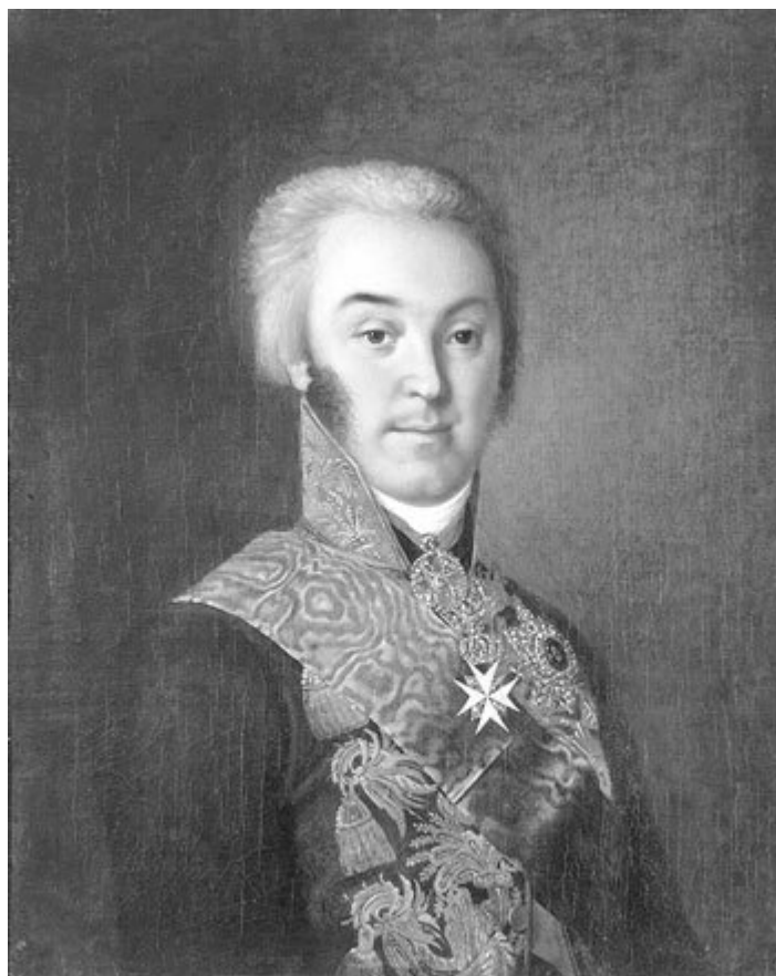
Граф Николай Петрович Шереметев

После переворота 1917 г. в здании находилась военная академия и музей Рабоче-крестьянской Красной армии и флота. В 1930 г. сломали флигели усадьбы и по улице вместо них и парадного двора выстроили уродливое здание для расширявшейся больницы. Со стороны переулка вход в старое здание находился в торце, и можно было наблюдать вереницы черных «Волг», куда обслуга несла пакеты с дешевой провизией для своих хозяев и себя.