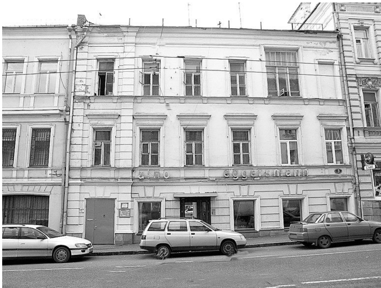
Ленивка, дом № 3

Иногда всю Волхонку именовали Ленивкой (это бывало и в середине XIX в.), а нынешняя улица Ленивка носила название либо «проезд к Каменному мосту», либо «Всехсвятская», по воротам стены Белого города, у которых находилась церковь Всех Святых.